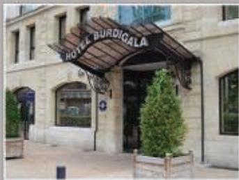
Bordeaux - Hôtel Burdigala * 26 juin 2014