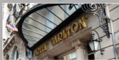
Lille - Hôtel Carlton * 18 septembre 2014