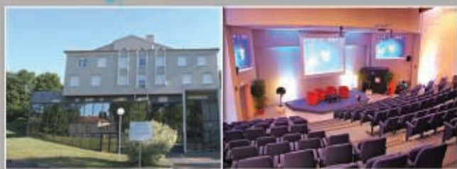
Lyon - Espace de l'Ouest Lyonnais 2 octobre 2014