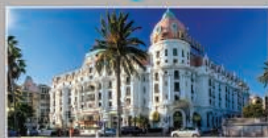
Nice - Hôtel Negresco * 6 novembre 2014

* Les participants qui le désirent pourront bénéficier de tarifs préférentiels sur la réservation de chambres.