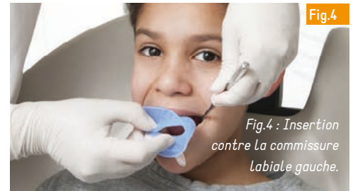
Fig.4 : Insertion contre la commissure labiale gauche.