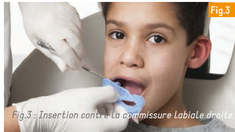
Fig.3 : Insertion contre la commissure labiale droite.