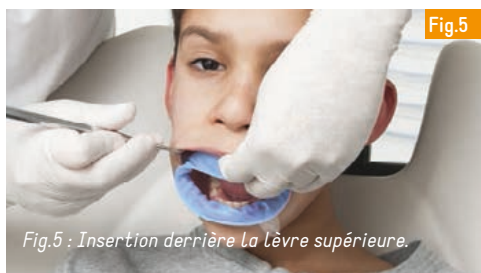
Fig.5 : Insertion derrière la lèvre supérieure.