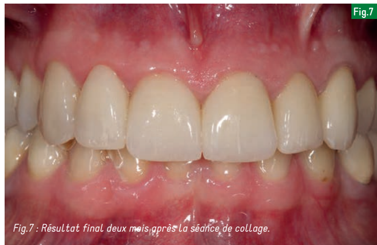
Fig.7 : Résultat final deux mois après la séance de collage.

Comme l'affirme Pascal Magne : Less is more , ce qui veut tout simplement dire que pour préparer moins il faut faire plus attention, anticiper et bien analyser ce que l'on fait. ■