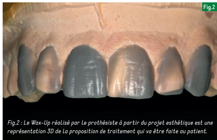
Fig.2 : Le Wax-Up réalisé par le prothésiste à partir du projet esthétique est une représentation 3D de la proposition de traitement qui va être faite au patient.

servir à transférer le projet directement dans la bouche du patient. Pour ce faire, la clé en silicone est remplie de résine composite bis-acrylique ( Luxatemp Star , DMG) puis insérée en bouche. Le point important à ce stade est de s'assurer que la clé en silicone est bien positionnée à fond. Après polymérisation, le tout est désinséré, les surplus sont enlevés et le reste de la résine est laissée en place. Pour savoir si le silicone était à fond, il suffit de lire l'excès de résine ayant débordé sur la gencive.