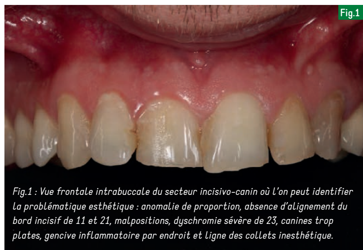
Fig.1 : Vue frontale intrabuccale du secteur incisivo-canin où l'on peut identifier la problématique esthétique : anomalie de proportion, absence d'alignement du bord incisif de 11 et 21, malpositions, dyschromie sévère de 23, canines trop plates, gencive inflammatoire par endroit et ligne des collets inesthétique.

Dans un premier temps, le prothésiste réalise un Wax-Up basé sur le projet esthétique du patient qui a été préalablement défini. Ce Wax-Up n'est autre qu'une représentation 3D de la proposition qui sera faite au patient ; (Fig 2). Un index en silicone peut alors être réalisé à partir du Wax-Up puis découpé de façon à mettre en évidence la position de l'enveloppe vestibulaire finale des futures restaurations, sur le modèle en plâtre ; (Fig.3a).