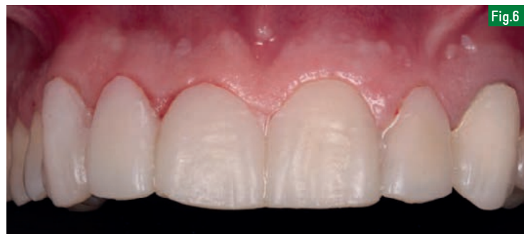
Fig.6 : Après la prise d'empreinte, à l'aide de la même clé en silicone qui a permis de faire le Mock-Up , un provisoire est immédiatement réalisé dans la séance avec de la résine bis-acrylique. L'assemblage se fera à l'aide d'une colle provisoire. Le bon ajustage et la bonne finition du provisoire permettront à la gencive de rester stable jusqu'à la séance de collage.

Dans le cadre d'une réhabilitation esthétique du sourire, la facette en céramique